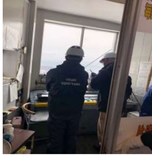
令和元年 12 月 9 日(索道救助訓練 ・ 予備原時操作実習)